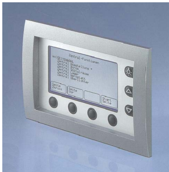
Slika 2. – Nadzorni LCD tablo proizvajalca JUNG

EIB inteligentna instalacija samostojno ukrepa glede na vplive iz okolja in nam s svojimi prednostmi olajša bivanje. Tako na primer: pri izhodu iz hiše lahko s preprostim pritiskom na tipko ugasnete pozabljene luči v hiši ali prekinete dovod toka do pečice, likalnika in hkrati spustite vse žaluzije. Skratka: inteligentna instalacija EIB stopnjuje individualno bivalno udobje, varnost, gospodarnost in to dan za dnem, celo življenje.