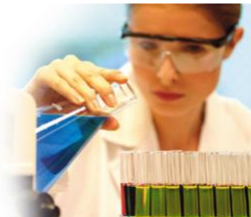
Slika 1: Polnjenje epruвет