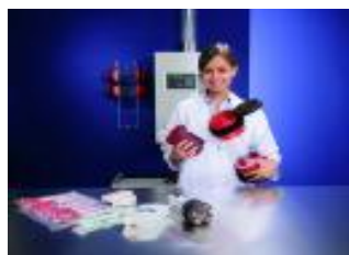
Slika 3,4,5 : Medikamenti za transport z ACZP

Vsak projekt ACZP je izdelan na osnovi spodaj omenjenih raziskav: