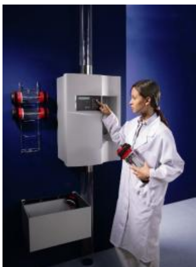
Slika 2 : Odpošiljanje vzorcev