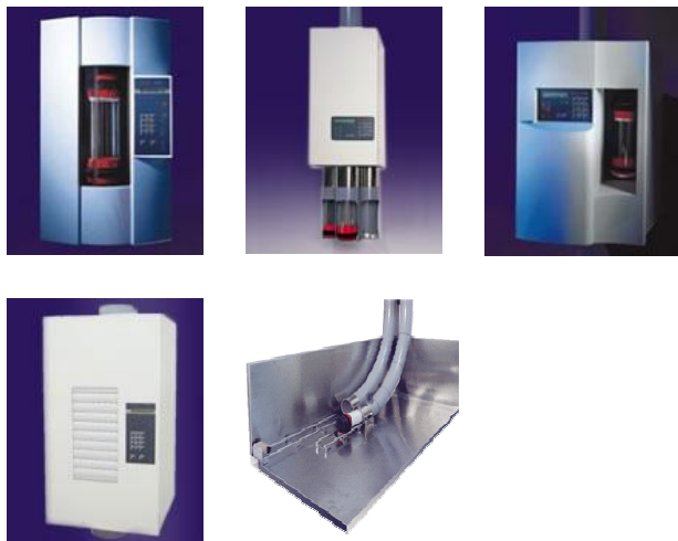
Slika 7,8 : Različni tipi avtomatskih laboratorijskih postaj cevne zračne pošte